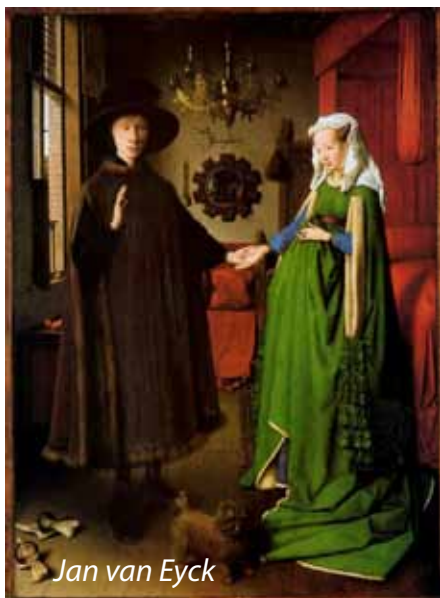
Jan van Eyck